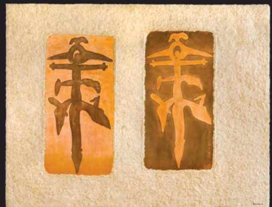
Tú eres sagrado