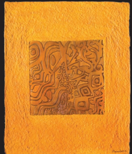
Somos el mundo