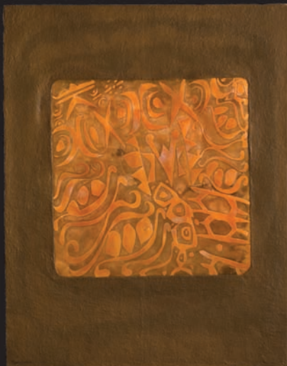
Que devolvemos a la naturaleza