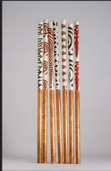
Mi esencia portada