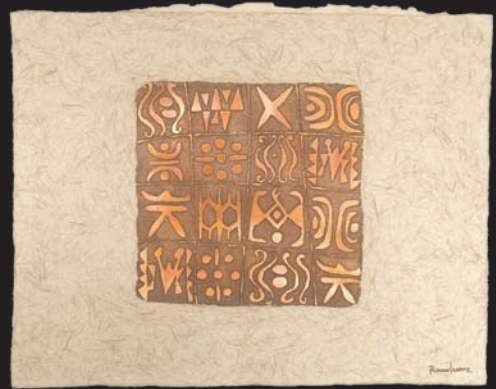
Traer la selva a la ciudad