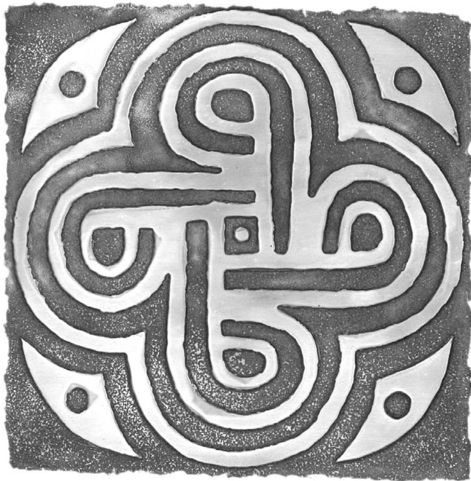
Árbol de las cuatro edades. Detalle