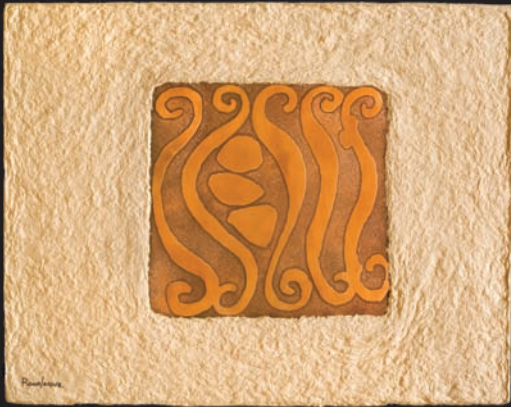
Paz para hoy