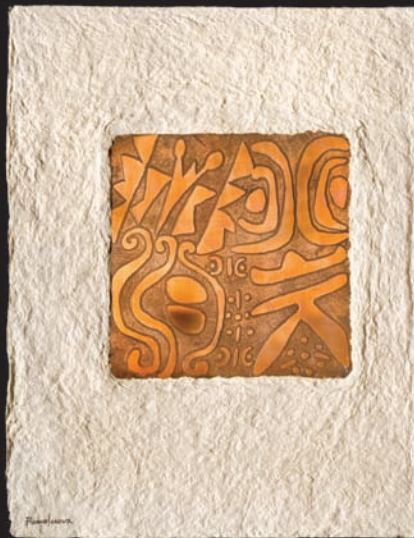
Tenemos derecho a la paz