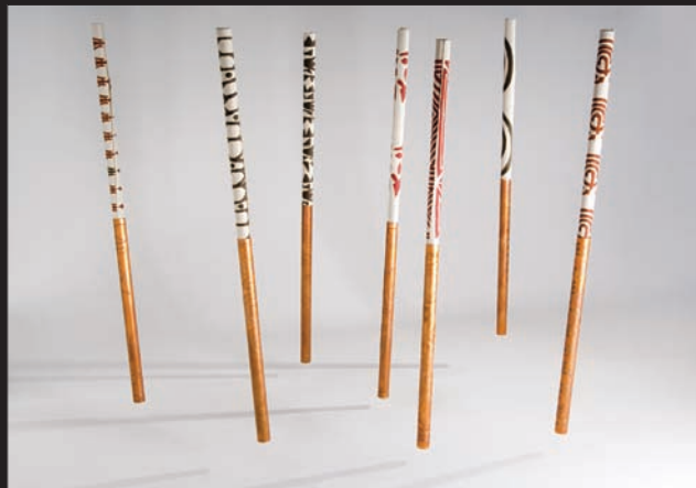
Mi esencia libro